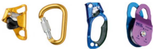
CROLL B16 ATTACHE M35 SL ASCENCION B17 RESCUE P50

Petzl har nylig oppdaget følgende produkter kopiert og produsert i Kina: